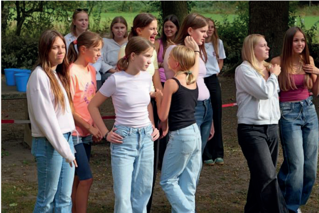
Die jüngsten Aktiven wurden für ihre erste Teilnahme an Wettkämpfen und Meisterschaften geehrt (Foto unten).